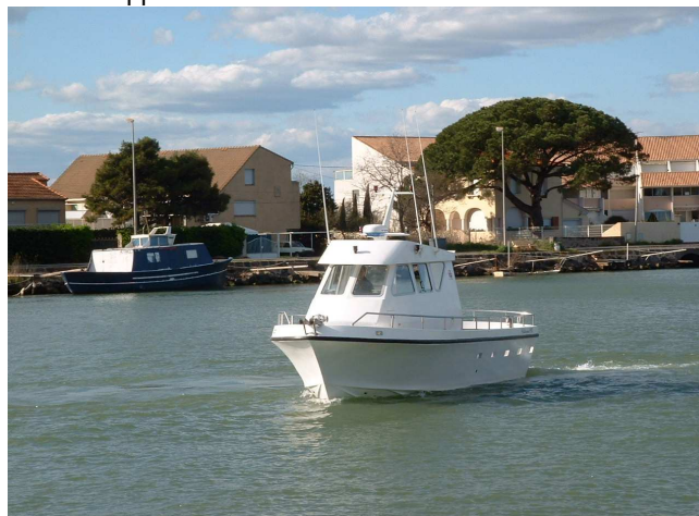
Bateau école « Scola di marina »