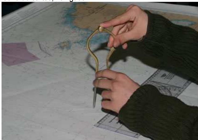
Exercices sur carte marine